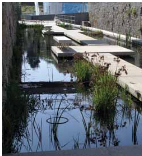
Terreiro do Rato

potencialmente mais a aprender. Os programas das tipologias já estudadas são mais fáceis de fazer, porque temos mais experiência e estudamos o modo como a paisagem se adequa aos usos.