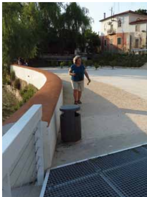
Passeio do Lis, Leiria