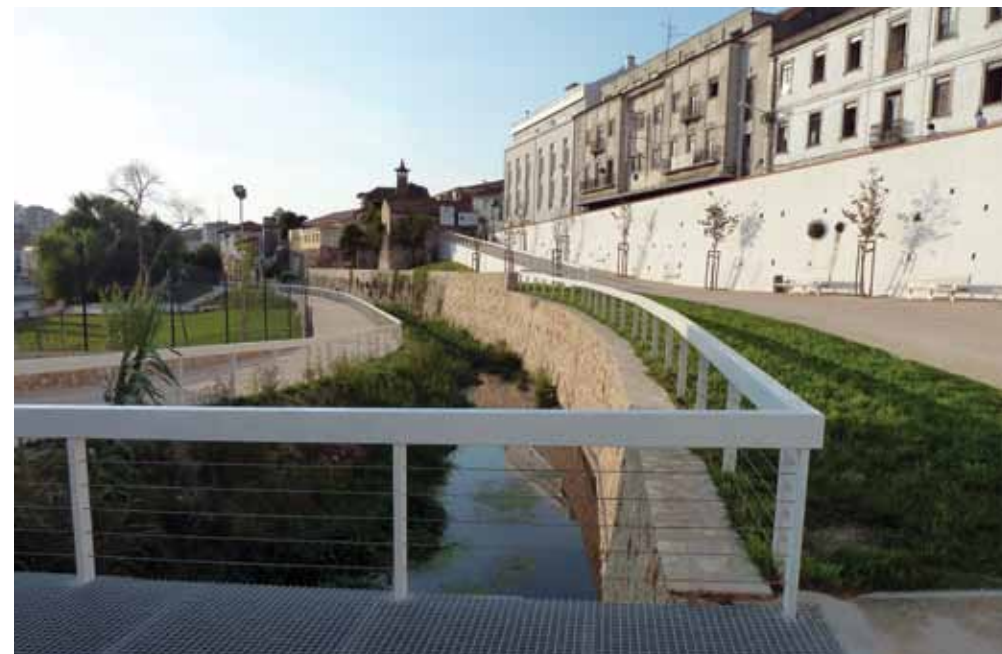
Passeio do Lis, Leiria