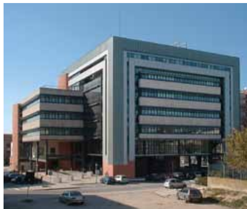
Tribunal do Barreiro

O conceito de património arquitetónico não está consolidado o suficiente para termos a noção do que é que deve ser preservado, mantido ou alterado. Penso que isso se deve a um enfoque que parte do património para a cidade em vez do contrário. Se partirmos do existente, e lhe dermos o adequado uso, estamos a valorizar património. Se partirmos do património, porque lhe reconhecemos um valor histórico, estamos a matar património. E temos morto muito património porque não sabemos dar-lhe capacidade de responder à cidade. Todos nós identificamos edifícios que foram destruídos ou destruídos por ausência de uma visão integradora do património, por não