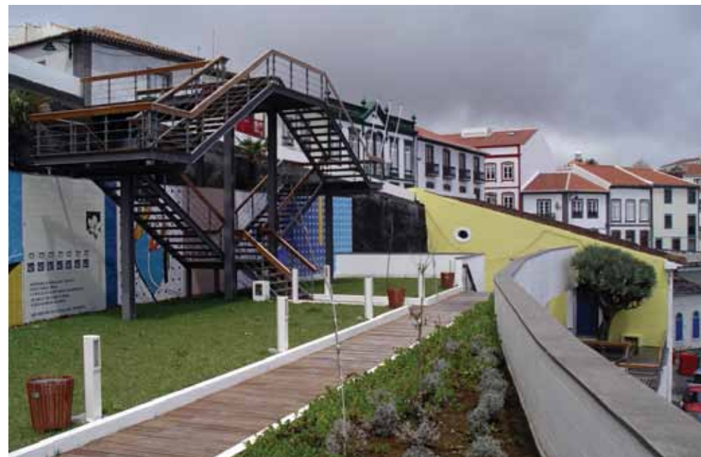
Cortes Reais, Angra do Heroísmo

Como foi criar um atelier de arquitetura na época instável que sucedeu ao 25 de Abril?