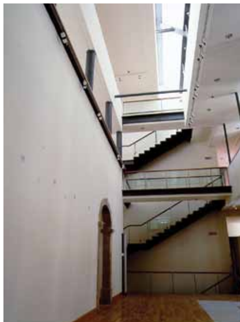
Centro Cultural de Cascais