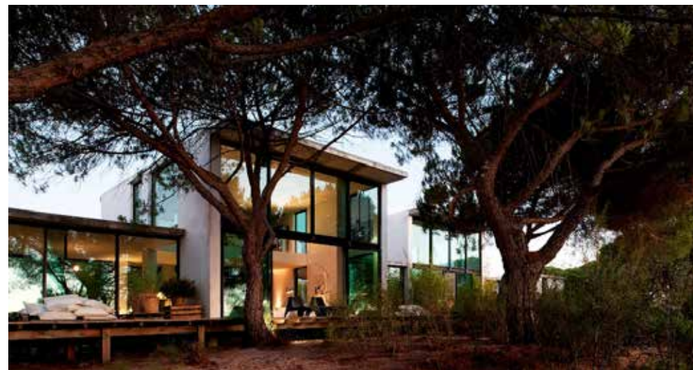
Casa na Comporta

Porque é que optou por tirar o curso no Porto? O que recorda desses tempos? E porque é que escolheu arquitetura?