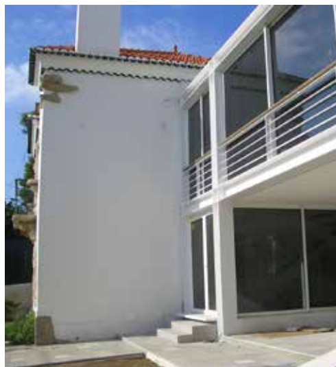
Casa no Monte Estoril