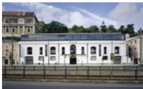
Banco Mais, Lisboa