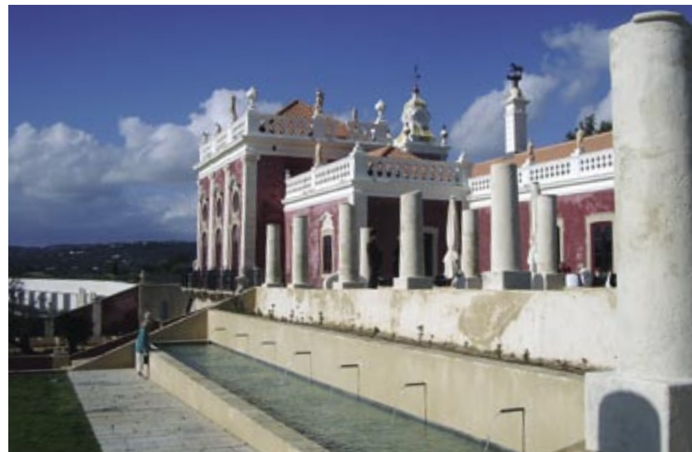
Pousada de Estói

Foi ainda na adolescência que decidiu que queria ser arquitecto. O que é que a arquitectura tinha, e tem, de irresistível?