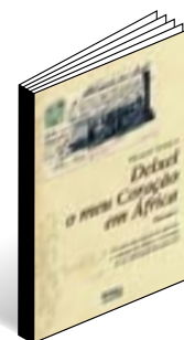
Deixei o meu coração em África