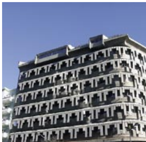
Edifício 'Franjinhas', Lisboa

Recordo-me de um edifício de escritórios, na rua Braamcamp, popularizado como “Franjinhas”, porque tem franjinhas de betão. É um edifício muito diferente e foi o resultado de um dos aspectos que considero mais importantes na arquitectura que é: o espaço construído tem de ter boas condições para as funções que aí se exercem. Muitas pessoas passam nos locais de trabalho grande parte da sua vida e, neste caso em concreto, eu esforcei-me para criar as melhores condições para que as pessoas se sentissem bem lá. Fiz aquilo que se chama arquitectura de dentro para fora. Há, muitas vezes, a tendência de imaginar o aspecto exterior do edifício e depois fazer o interior. Eu não concordo com isso. Sempre defendi que se deve partir das necessidades interiores do edifício. Na projecção do “Franjinhas”, pensei o espaço a partir da imagem da secretária de uma pessoa que ia estar ali dentro grande parte do seu dia. Pensei em termos de luz, de condições de conforto, de vista para o exterior... No fundo, as exigências interiores é que foram