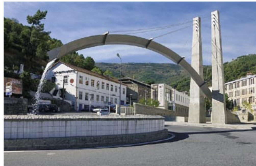
Rotunda do Rato, Covilhã

O Arq. Nuno Teotónio Pereira é conhecido, em parte, pelos projectos de habitação social que desenvolveu. Revê-se num papel social da arquitectura?