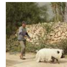
Título original: Le Cochon de Gaza De: Sylvain Estibal Com: Baya Belal, Myriam Tekaia, Sasson Gabai ALE/BEL/FRA, 2011, 98 min