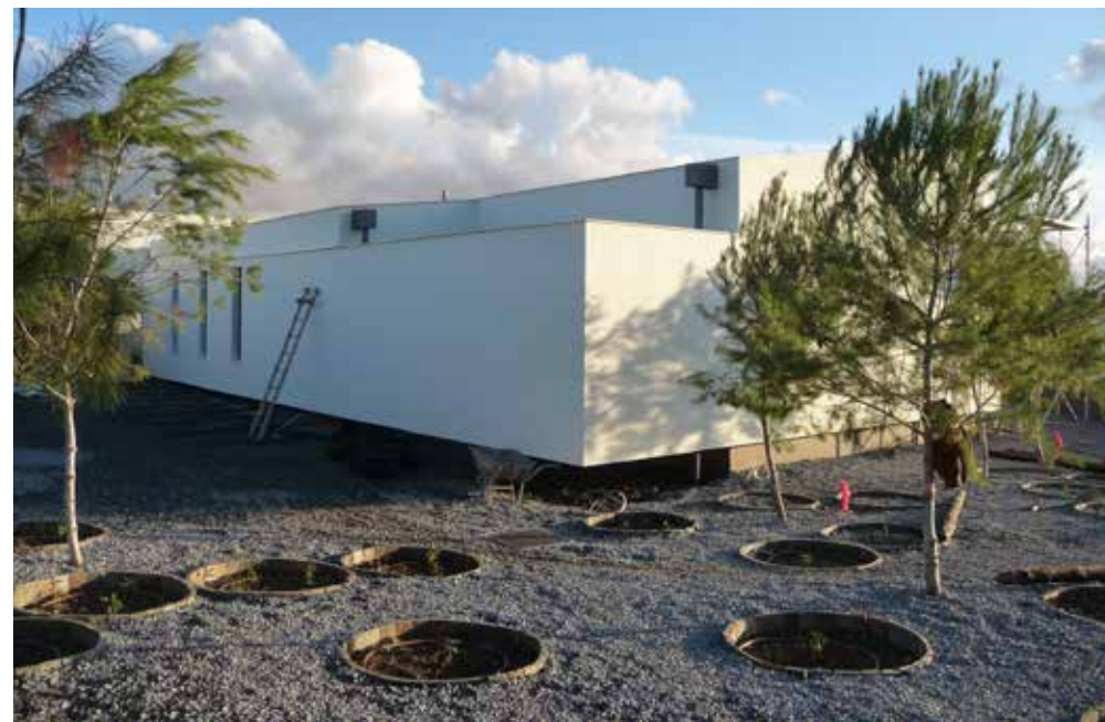
Centro de Saúde de Mourão

Ambos iniciaram a actividade profissional no Atelier do Chiado. Como surgiu a ideia de se juntarem para formar um atelier próprio?