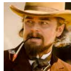
Título original: Django Unchained De: Quentin Tarantino Com: Jamie Foxx, Don Johnson, Leonardo DiCaprio, Samuel L. Jackson, Christoph Waltz M/16, EUA, 2012, 141 min

Estamos no oeste selvagem dos EUA em 1858. Dr. King Schultz, dentista e caçador de recompensas, compra o escravo Django, que tenciona libertar em troca de um pequeno favor: ajudá-lo a encontrar, mortos ou vivos, os irmãos Brittle, conhecidos por aterrorizarem a população com os seus atos de crueldade indiscriminada. Depois de o conseguirem, Schultz decide ajudar o ex-escravo a encontrar Broomhilda, a jovem esposa de quem perdeu o rasto algum tempo antes. Ao percorrer um longo caminho, chegam à enorme plantação do poderoso e cruel Calvin Candie, que enriqueceu à custa de trabalho escravo. Para que seja possível o resgate da rapariga, terão de lutar, não apenas contra Candie e os seus capatazes, como também contra preconceitos profundamente enraizados.