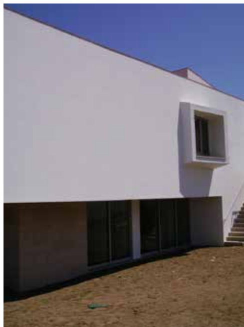
Casa na Várzea